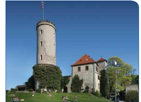
Die Sparrenburg, Bielefeld