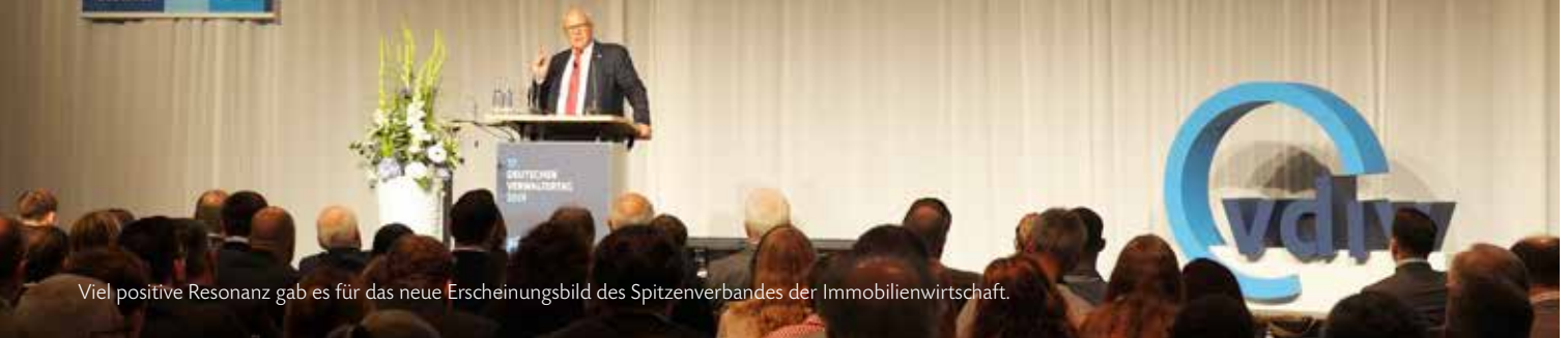
Viel positive Resonanz gab es für das neue Erscheinungsbild des Spitzenverbandes der Immobilienwirtschaft.