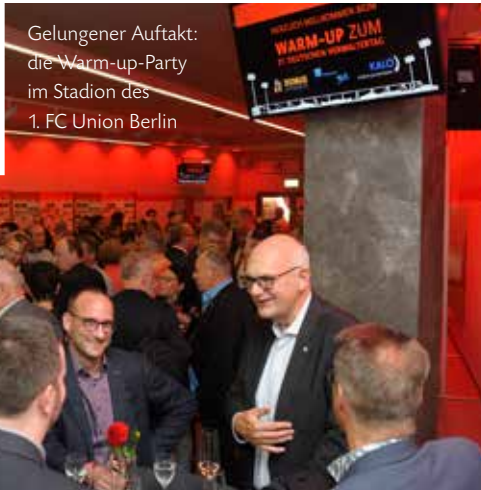
Gelungener Auftakt: die Warm-up-Party im Stadion des 1. FC Union Berlin